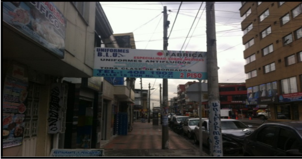
Fotografía No. 2: Aviso en espacio público.

Registro fotográfico, Visita de seguimiento efectuada el día 17-04-2015