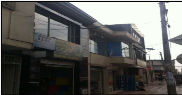
Fotografía No. 3 y 4: Aviso en fachada del establecimiento de comercio BOUTIQUE DE LUJO UNIFORMES , ubicado en la Calle 15 Sur No. 17-31. No cuenta con Registro de Publicidad Exterior Visual, desmonto la publicidad que se encontraba en las ventanas y en el espacio público.